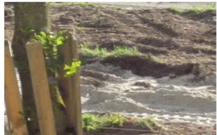
dinsdag 8.00 uur